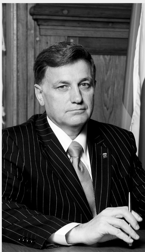
Секретарь Санкт-Петербургского регионального отделения Партии «Единая Россия», Председатель Законодательного Собрания Санкт-Петербурга В. С. Макаров

Уважаемые коллеги! От всей души поздравляю вас с Днем рождения Партии!